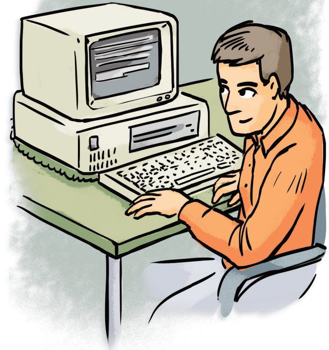
Invention de l'ordinateur