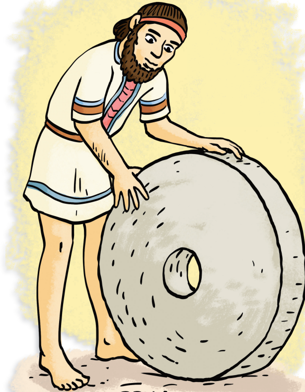
Invention de la roue