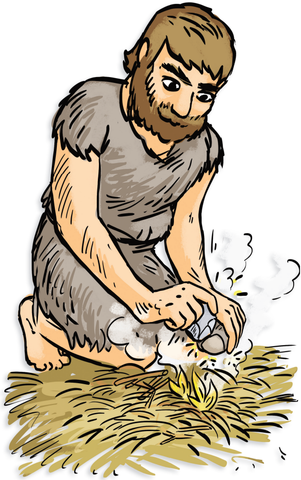
Découverte du feu